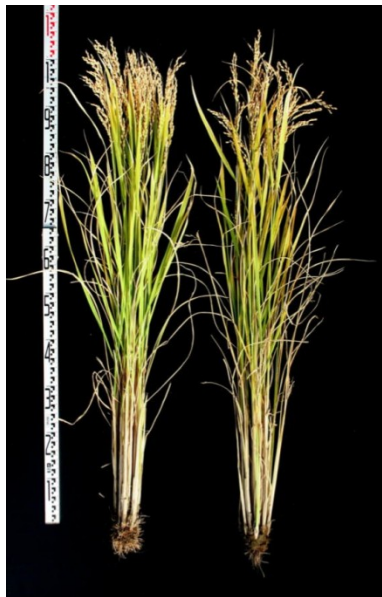
縞葉枯病抵抗性 ハツシモ ハツシモ