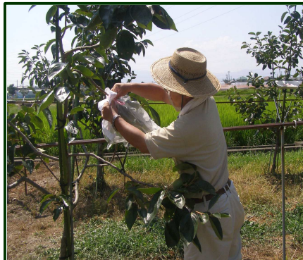
重要害虫「果樹カメムシ」 を対象とした薬剤試験