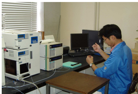
エダマメの成分 分析・解析

消費者からも良い評価を受けている「岐阜えだまめ」は、防虫ネットと有機質肥料を使用して安全・安心な栽培が行われています。本センターでは、うまみ、機能性成分である糖、アミノ酸などの成分量を分析し、これらの成分を増加させる栽培方法を開発しています。安全・安心に加え健康でおいしいエダマメ生産を進めています。