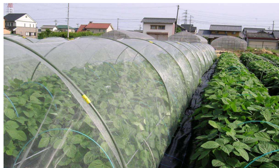
安全・安心に加え健康でおいしい エダマメ生産技術の確立！