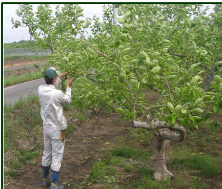
カキミガの性フェロモン剤 効果試験

新規に開発された農薬を一般で使用できるようにするには、人が服用する薬と同じように安全性や効果等に関する試験を行う必要があります。全国の公的研究機関では、薬効・薬害・残留試験を分担して行っています。本センターでも「ぎふクリーン農業」「農薬の飛散防止対策」「省力」「環境負荷軽減」等の現場や行政要望に応える農薬を中心に、試験を実施しています。