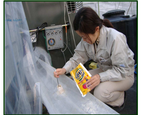
暖房機ダクトを利用した 生物農薬の散布試験