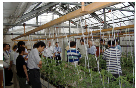
(南濃試験地での現地検討)