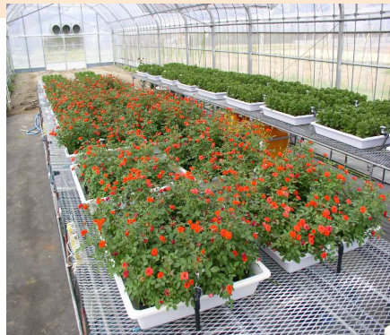
花き類の底面給水栽培