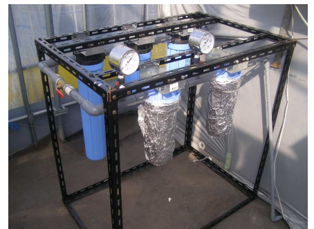
試作した除菌装置